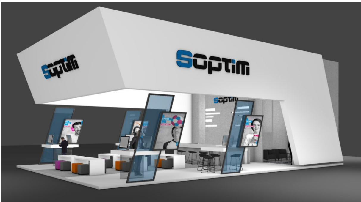
BU: SOPTIM Messestand 2022